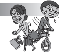
自転車を運転中、誤って他人と衝突、ケガをさせた。

※個人賠償責任については日本国内での事故(訴訟が日本国外の裁判所に提起された場合等を除きます。)に限り、示談交渉は原則として東京海上日動が行います。