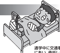
通学中に交通事故にあい、骨折した。