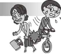
自転車を運転中、誤って他人と衝突、ケガをさせた。