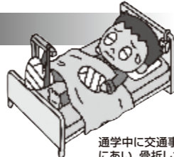
通学中に交通事故にあい、骨折した。